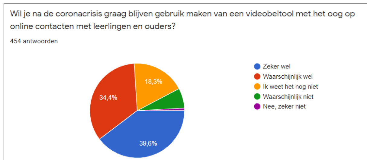
Figuur 1: resultaat bevraging CLB's toekomstig gebruik beeldbeltools

Via de bevraging in de CLB's (juni 2020 – 748 respondenten) zijn we nagegaan welke tools momenteel al worden gebruikt en hoe de ervaringen hiermee zijn. Interessant is dat bijna driekwart van de respondenten aangeeft dat ze in de toekomst gebruik willen blijven maken van beeldbeltools tijdens hun werk (zie Figuur 1).