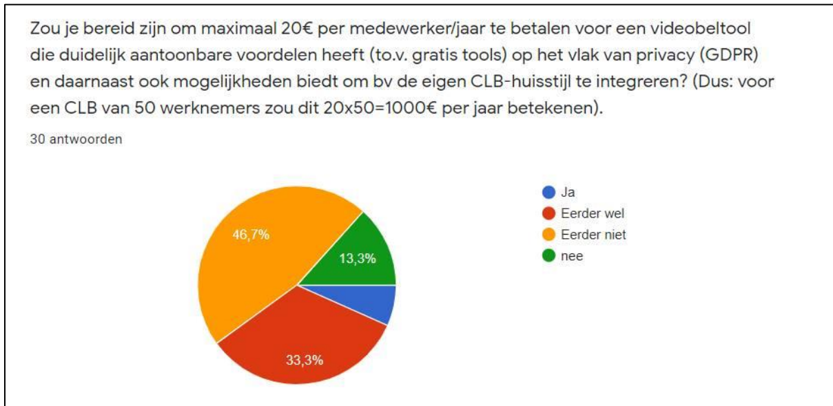
Figuur 2: resultaat bevraging CLB directies rond budget

(waar een licentie op Teams bijzit). Op moment van de bevraging hebben 43% van alle respondenten een MS Office 365 account.