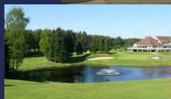
Golfhotel Stiemerheide Golf Spiegelveen Restaurant De Kristalijn