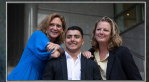
Els, SK en Eefje voor het Europees Parlement