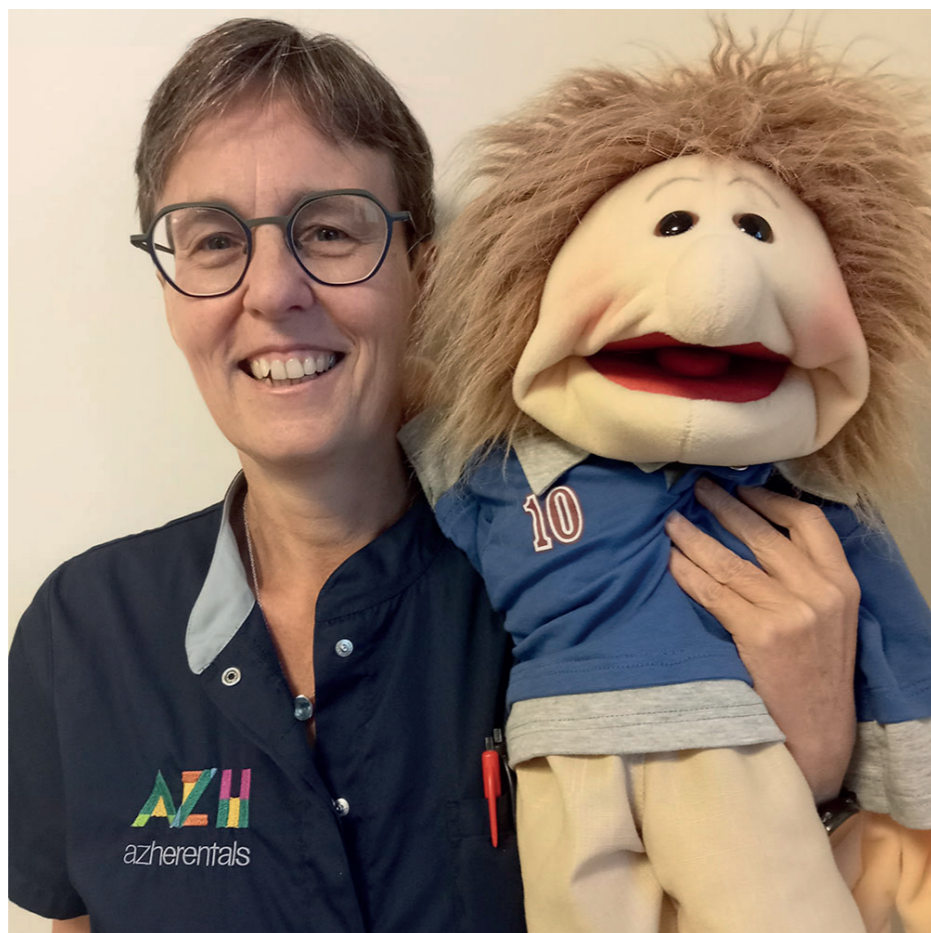
Els, pediatr AZ Herentals

Nu kan ik naast mijn werk meer tijd besteden aan wat me ook voldoening geeft: zelfzorg, mijn gezin, vrijwilligerswerk en momenten met vrienden. Mijn veerkracht betekent nu: mee buigen met de storm, kwetsbaarheid durven toelaten en stappen vooruit én achteruit waarderen."