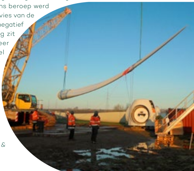
Foto: turbine in opbouw, Huysmanhoeve Eeklo in 2019. In 2023 bouwen we opnieuw vier windturbines (Lille & Schelle).

Vorige maand was er jammer genoeg ook minder leuk nieuws. Het project van zes burgerwindturbines in Mol is definitief opgeborgen ( www.ecopower.be/mol ), ondanks een reeks positieve adviezen. Hoewel de gemeente de zone zelf aanduidde als locatie voor windturbines volgde het gemeentebestuur vervolgens het eigen plan niet. Vlaams minister Demir deed mee en weigerde de vergunning enkele maanden geleden. Ecopower ging in beroep, maar de Raad van Vergunningsbetwistingen volgde dit niet. Ons beroep werd verworpen. Het advies van de minister blijft dus negatief en een vergunning zit er helaas niet meer in voor dit initieel veelbelovende project.