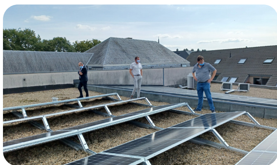
Zonnepanelen op het gemeentehuis in Alken.

Op de daken van het CC Ter Dilft en het Sportcentrum Breeven in Bornem wekken 510 zonnepanelen groene burgerstroom op voor de gebouwen zelf en voor de inwoners van Bornem. Ook de gemeente Alken is intussen drie coöperatieve zonnepaneelinstallaties en 60.000 kWh groene stroom per jaar rijker. Lees meer op www.ecopower.be/alken en www.ecopower.be/bornem .