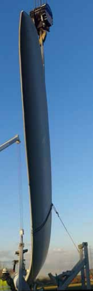
De wieken worden gehesen in Asse. Iedereen kan mee investeren.