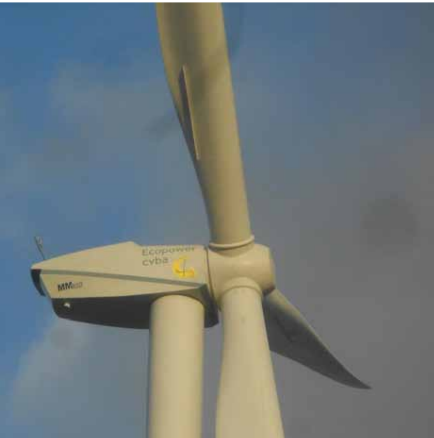
Eén van onze vier splinternieuwe windturbines in Asse. Onder: houtsnippersopslag in de pelletsfabriek.