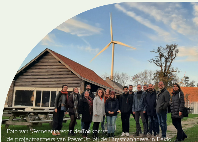
Foto van 'Gemeente voor de Toekomst' de projectpartners van PowerUp bij de Huysmanhoeve in Eeklo