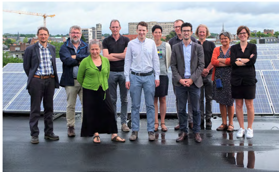
Op het dak van KA Redingenhof liggen collectieve zonnepanelen van Ecopower. LICHT Leuven werd er voorgesteld aan de pers.

Ecopower levert overigens alleen 100% hernieuwbare elektriciteit van binnenlandse herkomst. Het volledige rapport vindt u op de website van de VREG: www.vreg.be met de zoekterm 'rapport brandstofmix'.