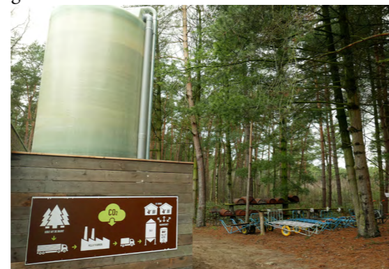
In Den Brink, een jeugdverblijf van Scouts en Gidsen in Herentals, vult Ecopower vanaf nu de silo met duurzame Belgische pellets.

60% van de energievraag in een huishouden gaat naar verwarming. Bij de productie houden we rekening met heel wat duurzaamheidsrandvoorwaarden zoals de herkomst van het hout. Onze pellets en briketten geven de laagste uitstoot van CO 2 en fijn stof en het hoogste rendement van houtverbranding. De verkoop van pellets steeg in 2017, maar er is nog veel uitbreiding mogelijk. Via REScoop Nederland en REScoop Wallonië boren we nieuwe afzetmarkten aan. Ecopower investeerde in een nieuwe zeef om het stofgehalte te verminderen en in een eigen oplegger om bulk te leveren. We slaagden in 2016 voor de ENPlus-audit voor de pellets en de briketten. Voor de pelletverkoop werd een extra personeelslid aangeworven.