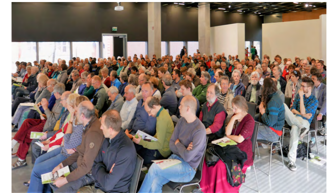
Een volle zaal in het KASK tijdens de algemene vergadering in Gent op 8 april 2017

De controlerende vennoten geven aan dat aan hun adviezen veel aandacht wordt gegeven. Het