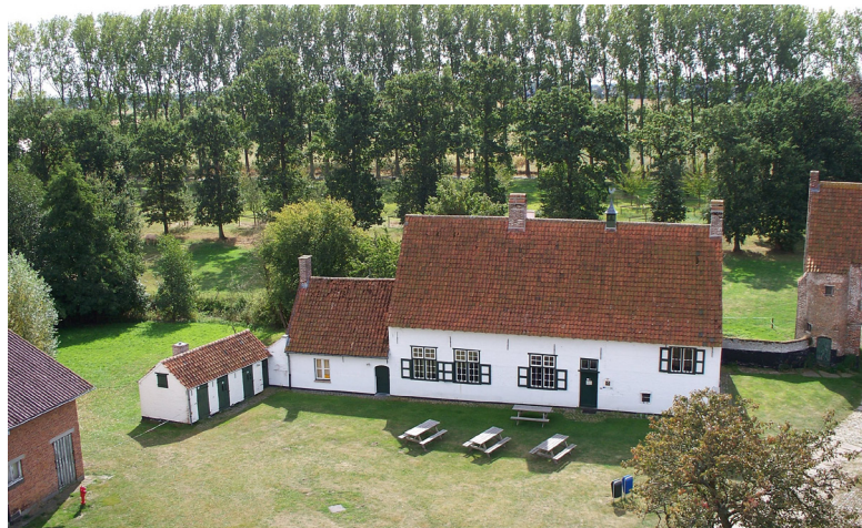
In de historische Huysmanhoeve in Eeklo huist het provinciale streekcentrum voor het Meetjesland.

In Eeklo worden intussen wel volop voorbereidingen getroffen voor de inplanting van een nieuwe turbine. Op het terrein is nu nog niet zo veel te zien. In het voorjaar van 2019 zal de windturbine aan de Huysmanhoeve elektriciteit op het net zetten, waarmee we ongeveer 3000 huishoudens van lokale, hernieuwbare elektriciteit kunnen voorzien.