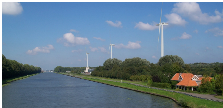
Simulatie van de geplande turbines in Ranst

Voor het jaar 2018 stond de bouw van vier windturbines op het programma. Drie in Ranst en een in Eeklo. Jammer genoeg heeft het project in Ranst, bij drinkwatermaatschappij water-link, vertraging opgelopen. Een beroep tegen de bouwvergunning werd onverwacht aanvaard. Omdat Ecopower zich samen met water-link engageerde om natuurversterkende maatregelen te nemen op de site, is er volgens de raad voor vergunningsbetwistingen een milieueffectenrapport (MER) nodig. Dit terwijl de auditeur van de Raad van State eerder opmerkte dat een MER geen bijkomende relevante informatie zou opleveren. We zitten in Ranst dus verwickeld in een procedurekwestie die opgelost moet worden vooraleer we echt kunnen starten met de bouw.