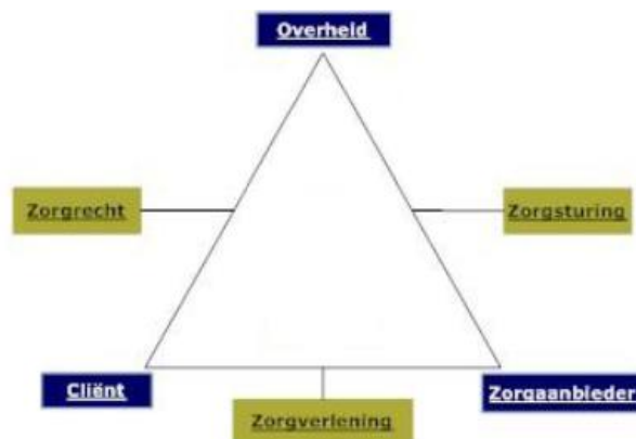
Figuur 1. Zorgdriehoek 4

De visualisering van deze verschillende actoren en hun onderlinge verhoudingen levert volgende zorgdriehoek op: