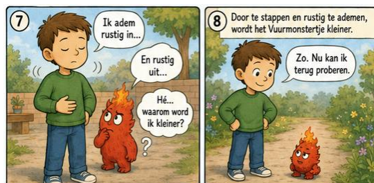
Fragment van AI-gegenereerd psycho-educatief stripverhaal