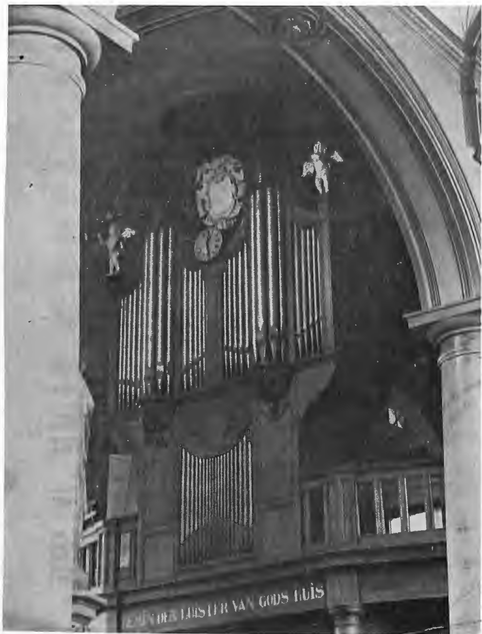
NEDERZWALM, P. Haelvoet ; 1855