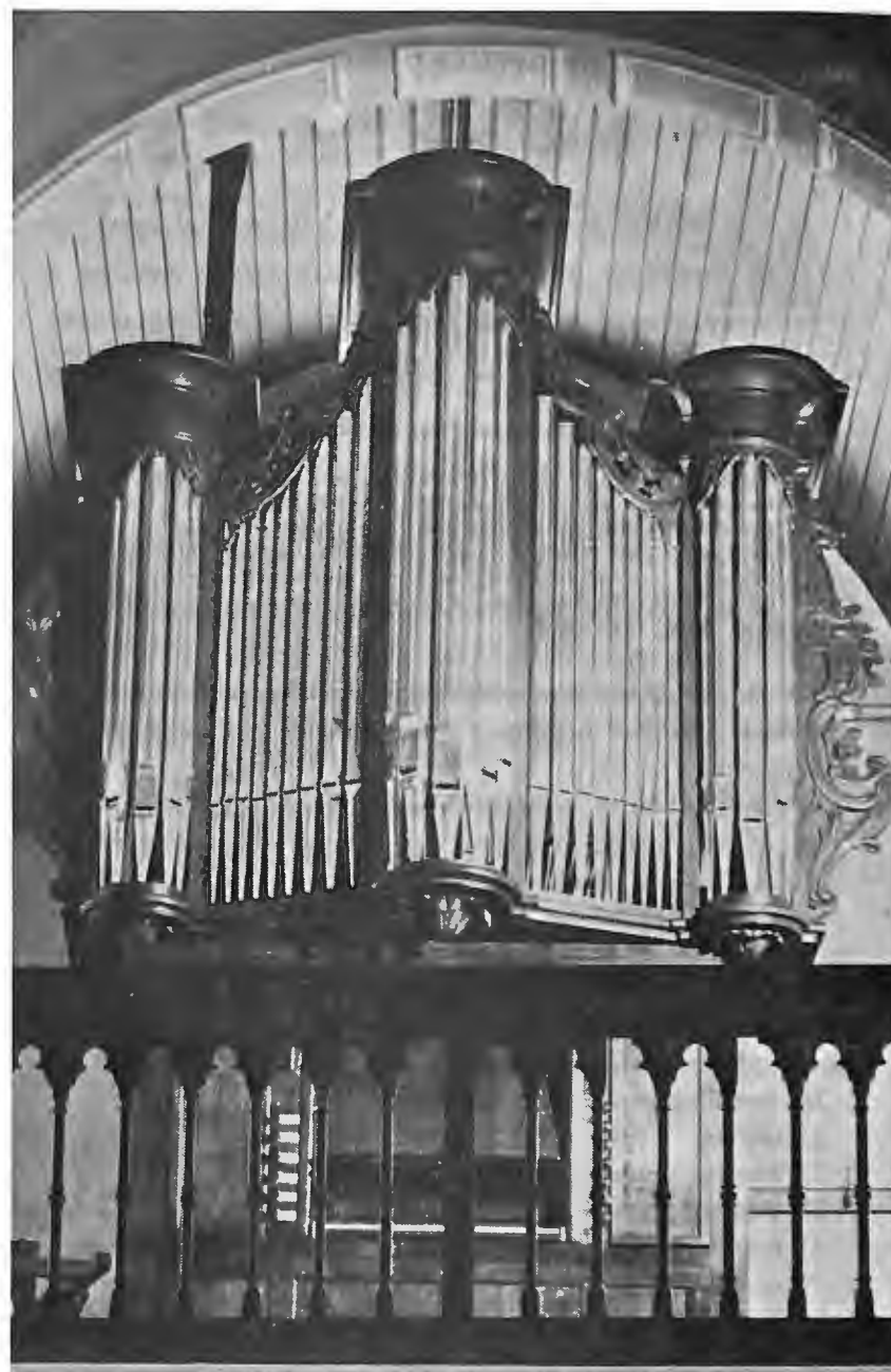
DENDERBELLE, P.-J. Vereecken ; 1859