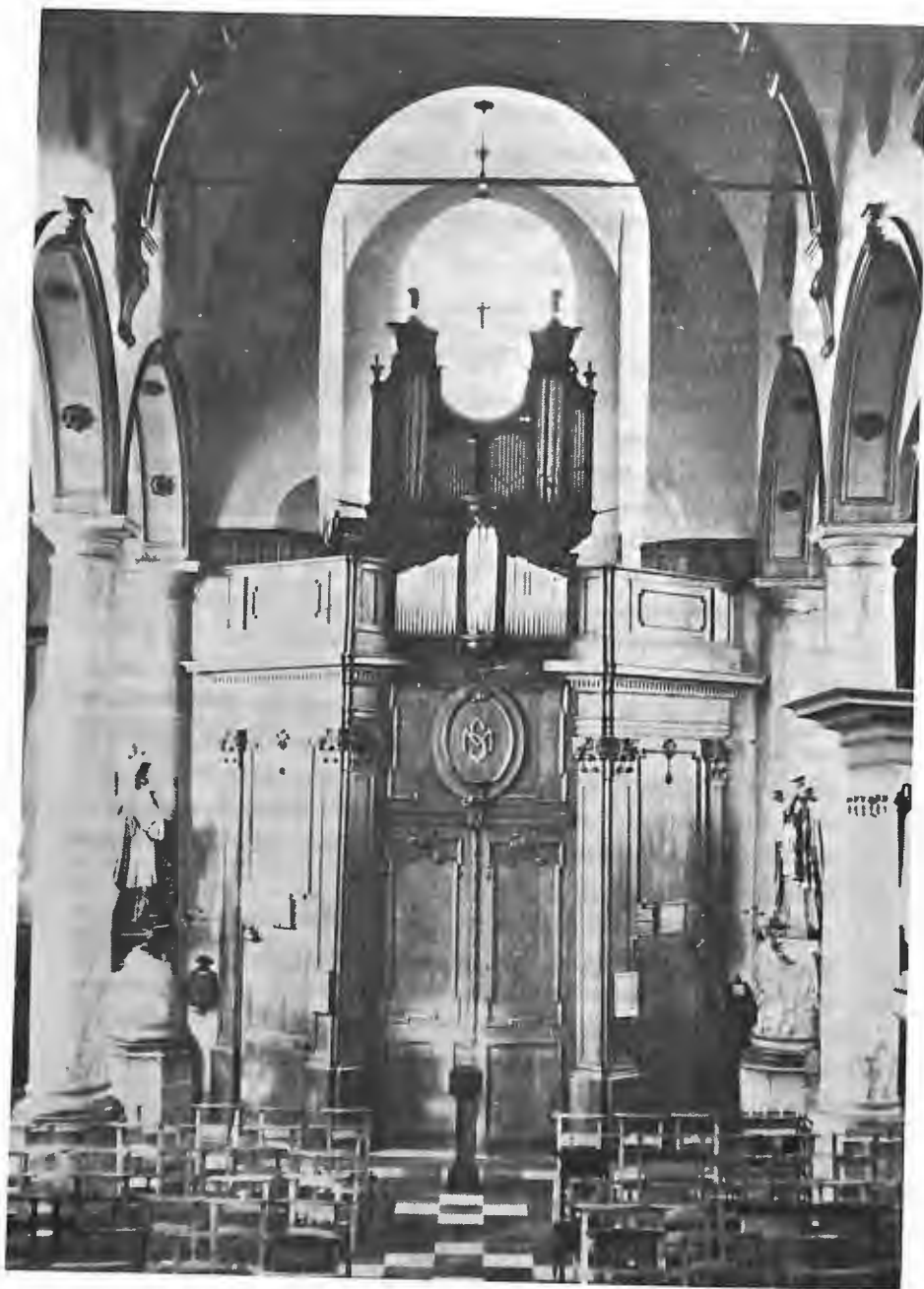
Doksaal en orgel in de Sint-Martinuskerk te Sint-Lievens-Esse.