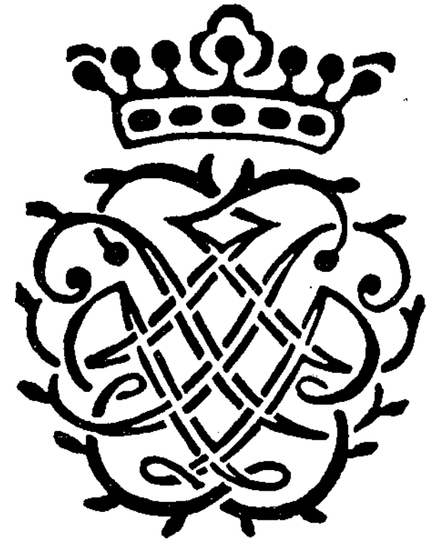
Het zegel van J.S. Bach

Eerst in 1802 verscheen de eerste eigenlijke biografie van J.S.B., geschreven door N. Forkel.