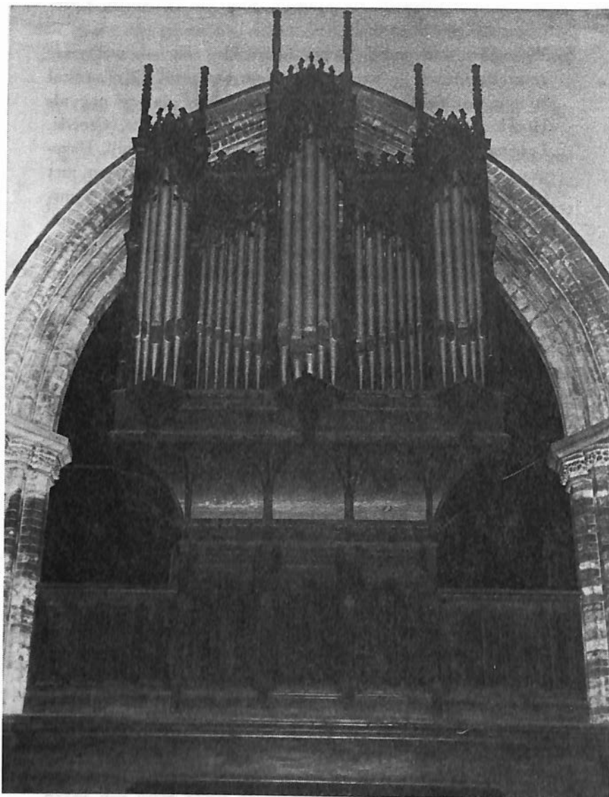
Brugge, St.-Gilliskerk, zijbeuk

Orgel van L.B. Hooghuys, gebouwd ca. 1874