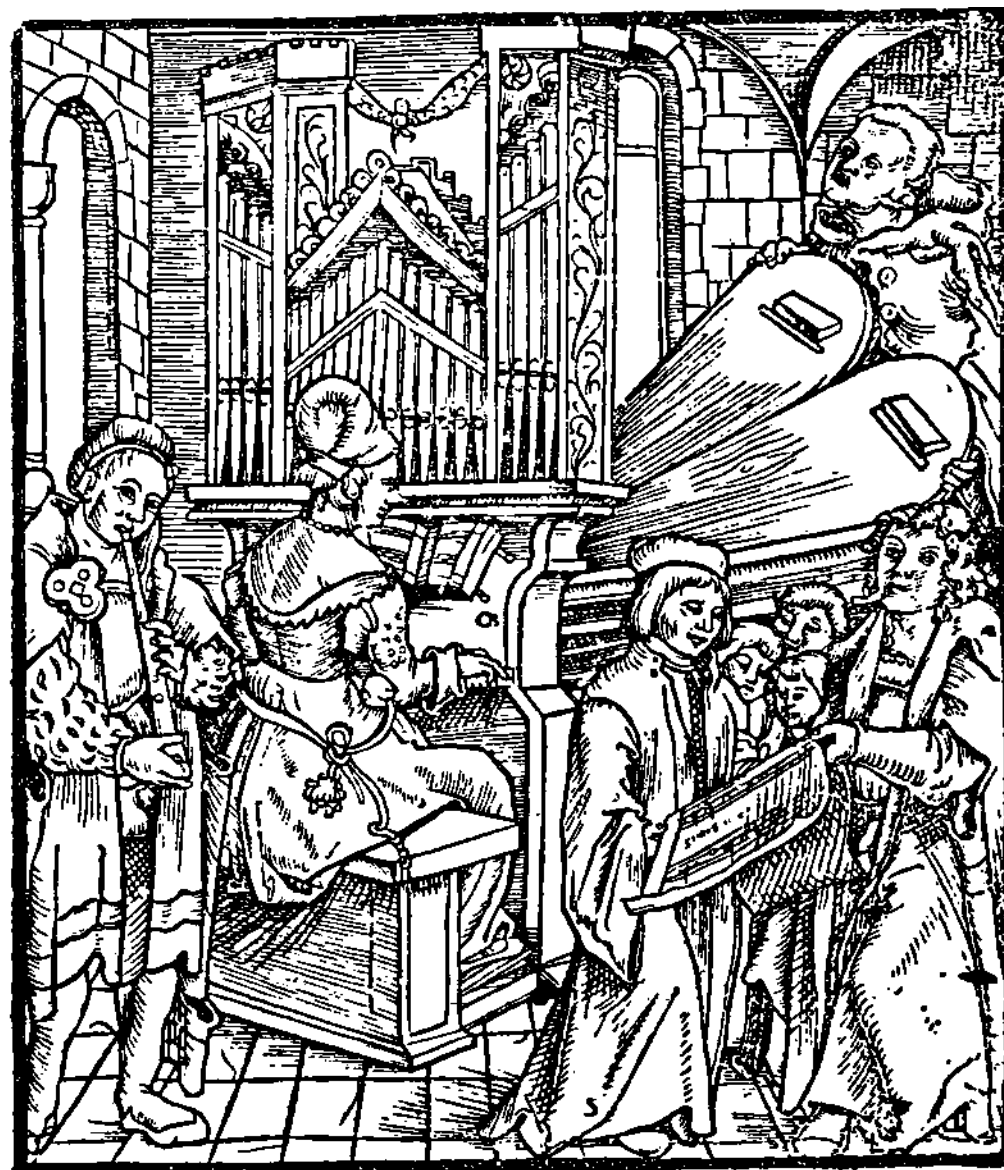
Titelbladzijde van het origineel. In 1511 gedrukt door Peter Schöffer te Mainz.

Zij maken ook een éénkorig register dat een kwint klinkt boven de principaal of de juiste toonhoogte van het instrument. Laat zij die dit mooi vinden, het prijzen.