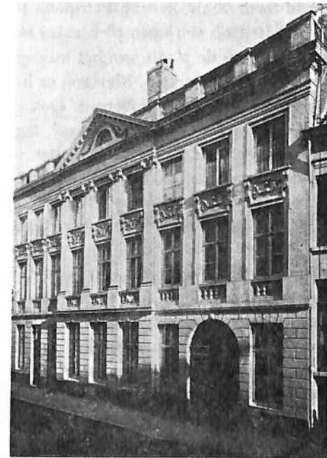
Foto van dezelfde woning omstreeks 1920