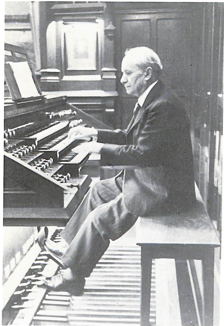
Charles Tournemire aan het Cavallé-Coll-orgel in de Ste Clotilde te Parijs (foto vóór 1933). Op dit orgel speelde C. Franck van 1859 tot 1890 en Tournemire tot zijn dood in 1939. Na zijn dood kwam de speeltafel naar Flor Peeters te Mechelen, waar zij van 1945 tot 1986 in de studio van de meester stond. Flor Peeters vermaakte de speeltafel aan het Kon. Vlaams Muziekconservatorium te Antwerpen, afdeling Oude Instrumenten.

Dat aldus ook onze werklijst anno 1987 niet alle vragen i.v.m. Pieter Van Peteghems oeuvre zal oplossen spreekt vanzelf. Maar we voelen onze inspanning ruimschoots beloond als dit nummer van Orgelkunst kan doorgaan als een handige en betrouwbare «nieuwe werklijst van P. Van Peteghem».