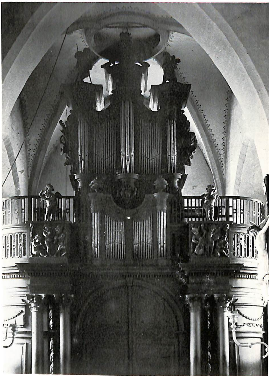
Belsele, St.-Andreas & Ghislenuskerk Van Peteghem, 1784