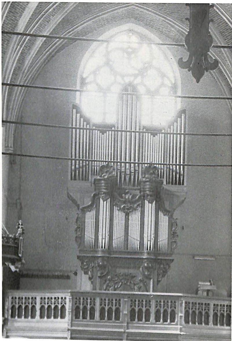
Aalter, St.-Corneliuskerk Van Peteghem, 1754