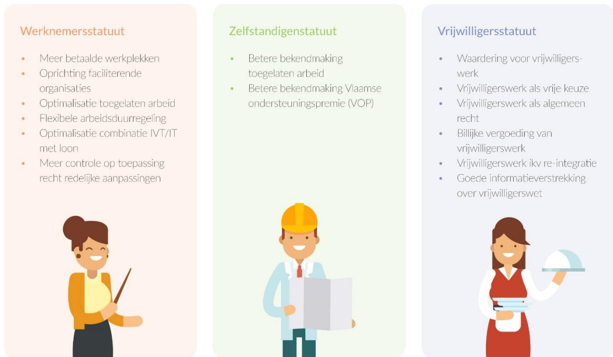
Figuur 2. Overzichtsschema van de verschillende statuten en acties die nodig zijn om deze statuten te optimaliseren voor de inschakeling van ervaringsdeskundigen.