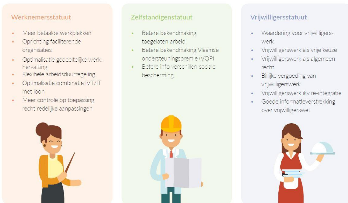
Figuur 2. Overzichtsschema van de verschillende statuten en acties die nodig zijn om deze statuten te optimaliseren voor de inschakeling van ervaringsdeskundigen.

Wanneer een organisatie of instelling een ervaringsdeskundige wil inschakelen, is het belangrijk om met een aantal zaken rekening te houden en hierover in dialoog te gaan: in welk statuut bevindt de persoon zich, welke aanpassingen zijn er nodig en hoe kan de persoon gewaardeerd worden voor zijn of haar inspanningen?