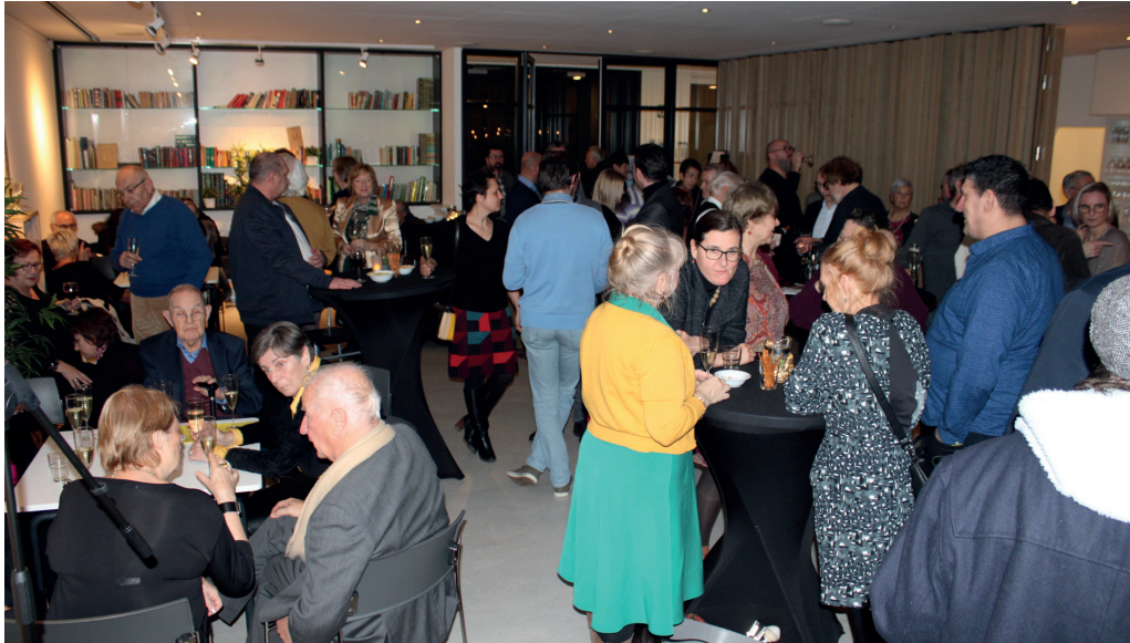
Nieuwjaarsreceptie in het Vrijzinnig Punt Hasselt