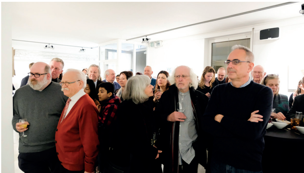
Nieuwjaarsreceptie in het Vrijzinnig Antwerps Trefpunt Out of a Box (@ Guy Kleinblatt)