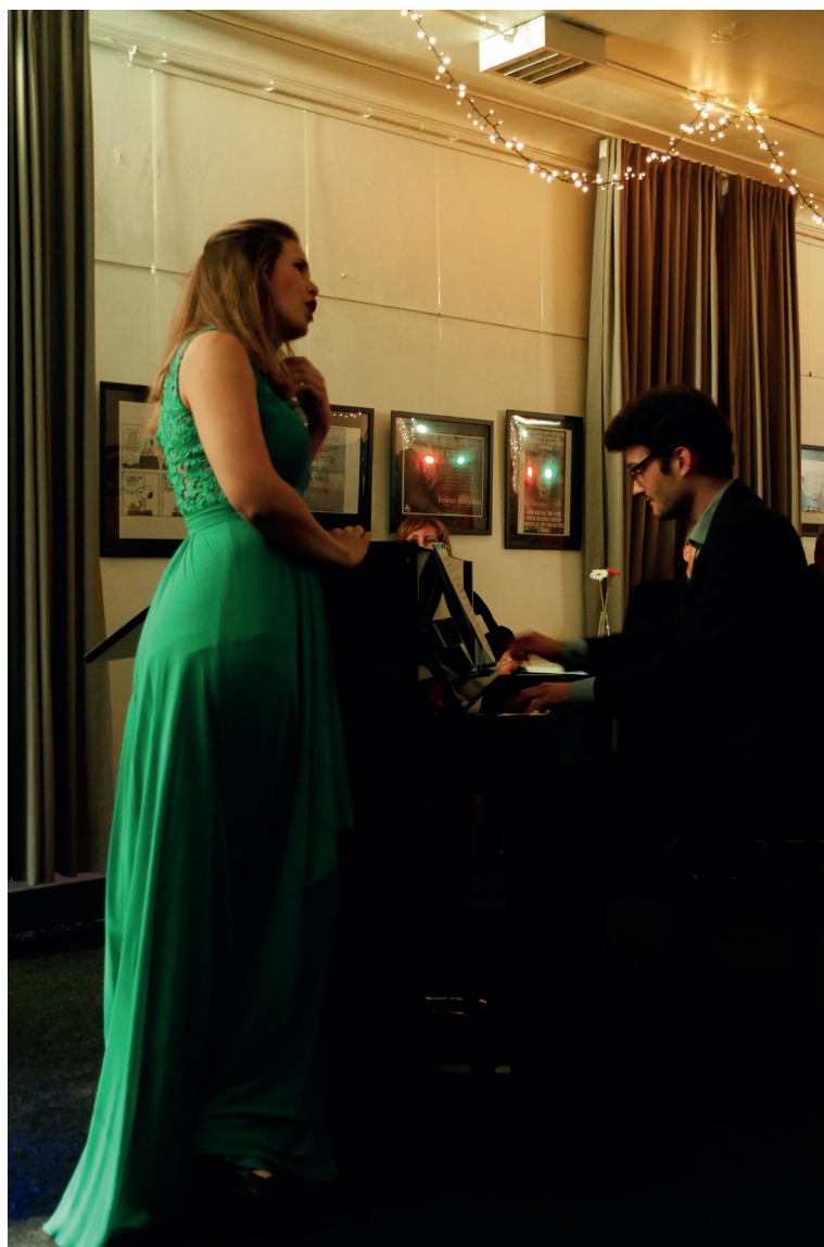
Nieuwjaarsreceptie in het Vrijzinnig Ontmoetingscentrum Vilvoorde

V.U.: Geert Royemans, Triomflaan 40, 1160 Oudergem