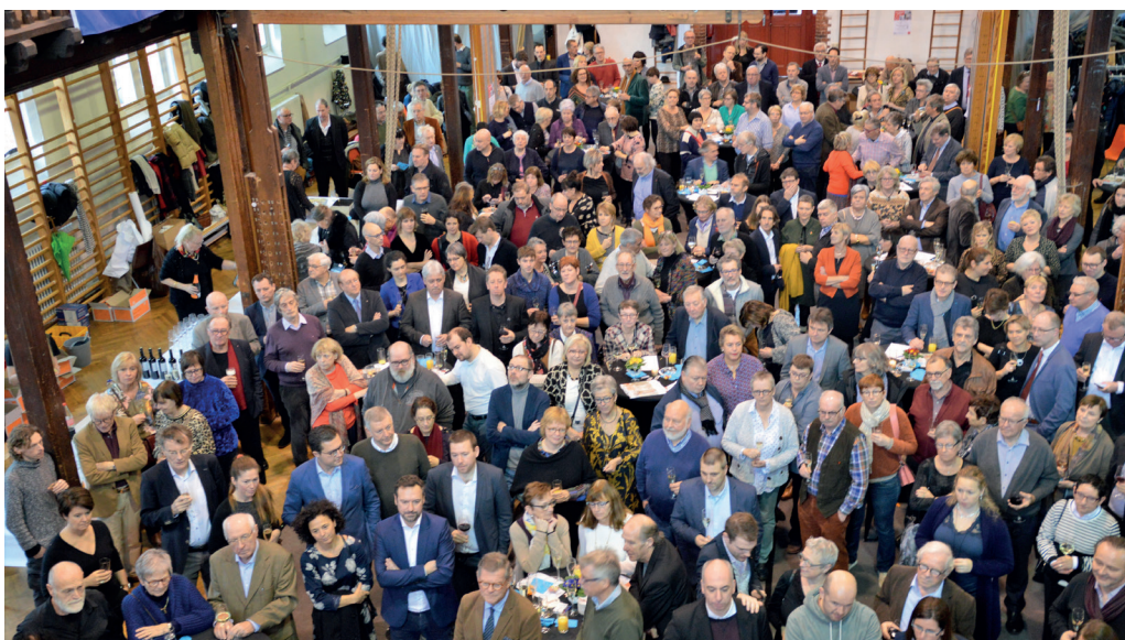
Nieuwjaarsreceptie in de HOWEST turnzaal van Brugge