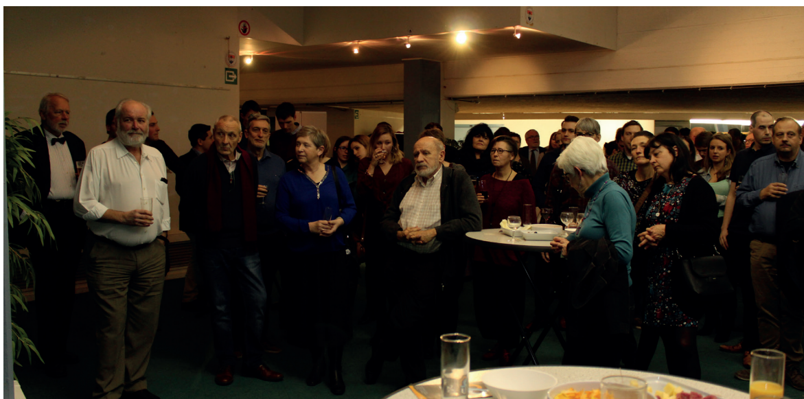
Nationale nieuwjaarsreceptie deMens.nu en OSB aan de VUB