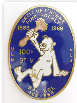
St. V-medaille van 1988 met als thema "Mensenrechten"