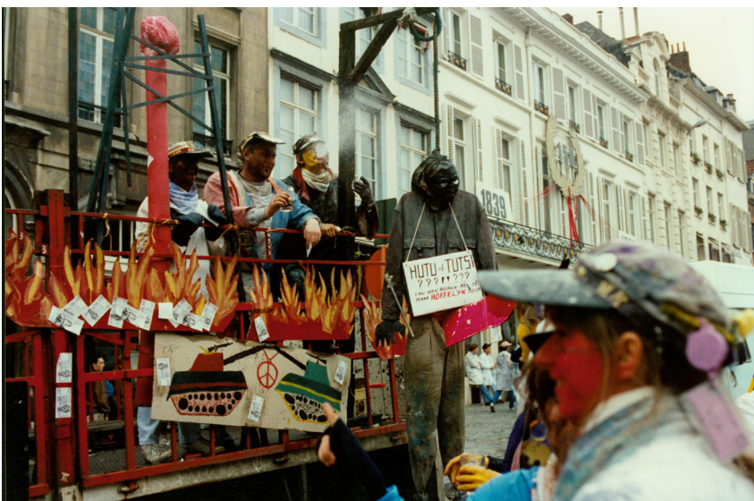
St. V 1994 na de rellen Hutu-Tutsi

de camions misschien niet meer van toepassing. Dit houdt de studenten echter niet tegen om samen met een kritische geest deze dag te vieren. Dus zet je klak op, kom op 18 november naar Brussel en geniet samen met alle studenten van deze bijzondere feestdag!