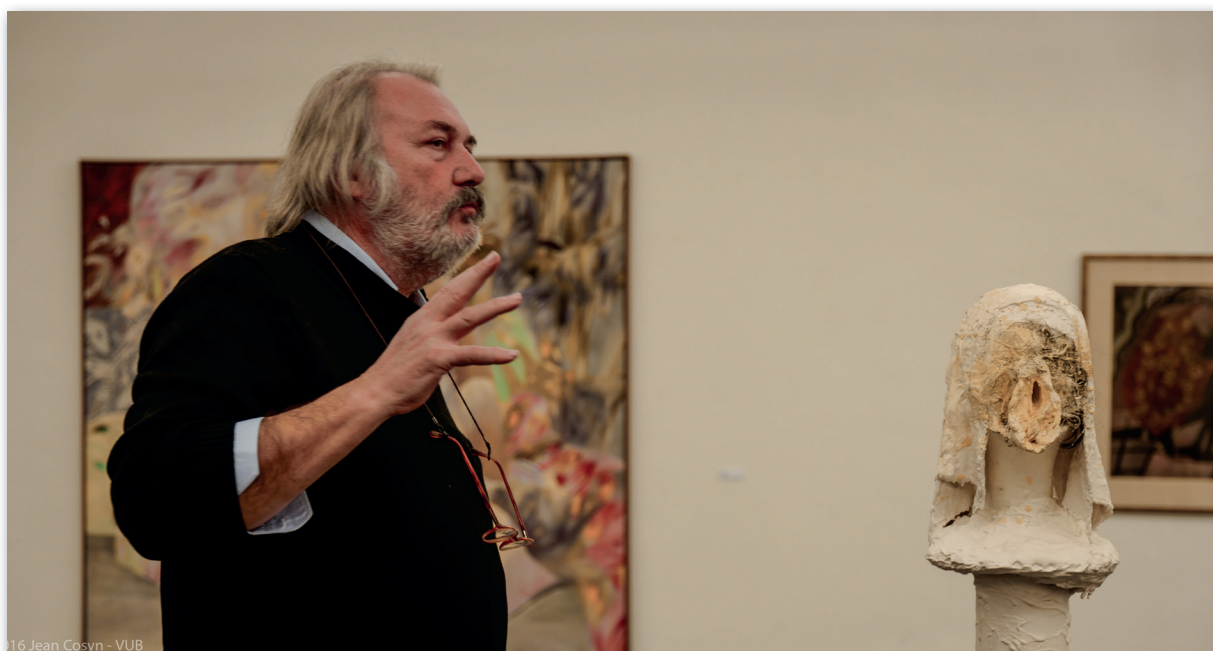
16