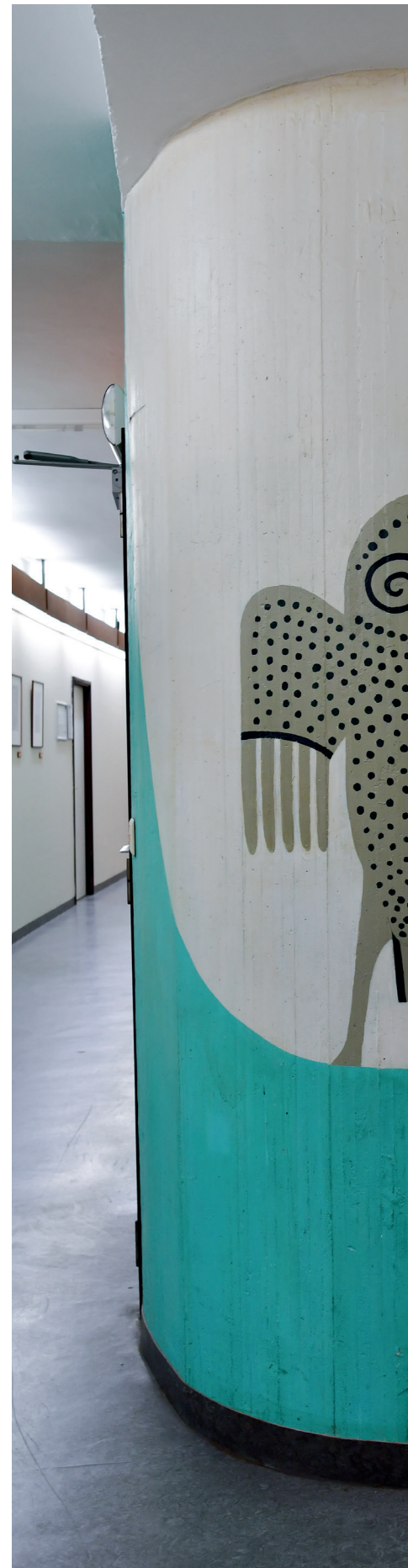
Tegenover het kantoor van de rector (5e verdieping)

Braem hecht veel belang aan de inkom van zijn realisaties. In de inkomhal brengt een energiek lijnenspel kleur met tegels in VUB-kleuren “oranje-blanje-bleu”. De gevel van het Braemgebouw wordt bekroond met een golvende betonnen luifel. Deze bevat een aantal symbolische reliëfs die verwijzen naar de universiteit, het Vrij Onderzoek en het vrije denken. We vinden er onder andere het wapenschild van de universiteit op terug. Een fakkel – symbool voor het licht in de duisternis – wordt omringd door elementen die wetenschappelijk onderzoek uitbeelden: de passer staat voor het meten, het oog voor het zien, de spiraal voor het begrijpen,