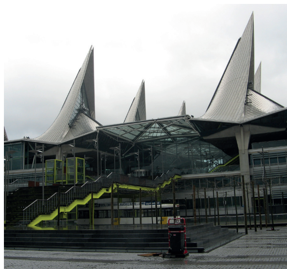
Gerechtsgebouw Antwerpen, ontwerper: TV RRP/VK/OAP