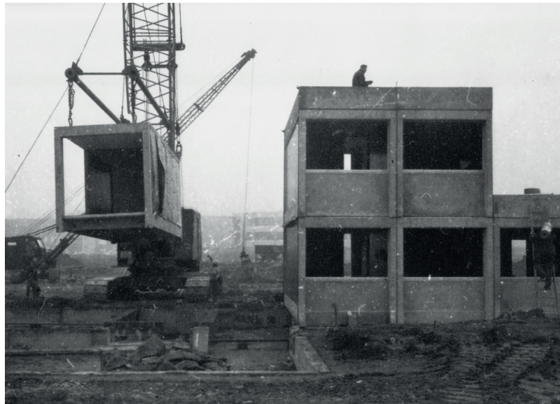
Toen nog in aanbouw, ondertussen al enkele jaren afgebroken: het KulturKaffee. © Foto: CAVA, architect: Willy Van Der Meer

Iets anders wat mij opgevallen is, zijn de innovatieve zaken die in alle gebouwen zijn verwerkt. Gaande van de meetapparatuur die al in het oude zwembad ingebouwd was, tot de zwarte panelen aan de zijkant van het KulturKaffee. Met deze panelen werd warmte opgevangen die gerecupereerd kon worden dankzij deurtjes op de vensterbanken. Eigenlijk waren dat dus de eerste zonnepanelen.