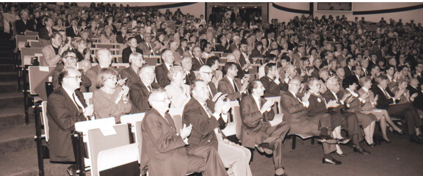
Academische openingszitting 1992-1993 in aula Q, 06/10/1992

Wie het heeft over rituelen en tradities aan de universiteit, denkt direct aan rituelen van de kringen, zoals de doop of de ontgroening. Maar elke zichzelf respecterende universiteit heeft ook officiële tradities: de academische openingszitting, de Sint-Verhaegenviering of de plechtige proclamatie.