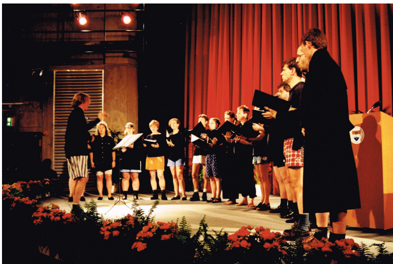
De Zangfaculteit in boxershort tijdens de academische openingszitting 1999-2000, 01/10/1999

De vorm van de academische opening past zich vlotjes aan de wijzigende omstandigheden aan. In 2003 wordt de Universitaire Associatie opgericht en dus breidt het aantal sprekers in de jaren erop uit. Niet minder dan zeven sprekers nemen het woord in 2006, wanneer de opening samen met de Erasmus-hogeschool gehouden wordt. Rector