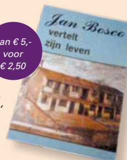
Boek 'Jan Bosco vertelt zijn leven'