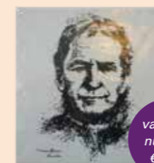
Tegeltje Don Bosco porselein 11 x 11 cm