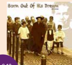
CD 'Born out of his dream', Stijn Convents