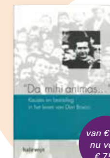
Boek 'Da mihi animas'...keuzes en bezieling in het leven van Don Bosco'