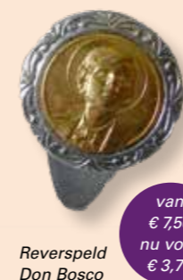
Reverspeld Don Bosco

Bestellen kan via www.donboscowerken.nl/webshop . Je kunt je bestelling ook telefonisch doorgeven via 06 17498124 of per mail via donboscowerken@donboscowerken.nl . Je krijgt je bestelling binnen een week thuis gestuurd.