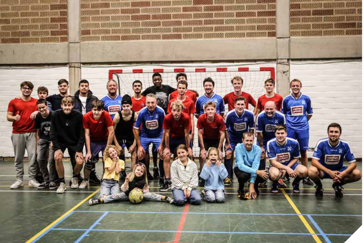
Iedere dinsdagavond neemt het leerkrachtenteam van Don Bosco Halle het op tegen een ploeg van leerlingen.