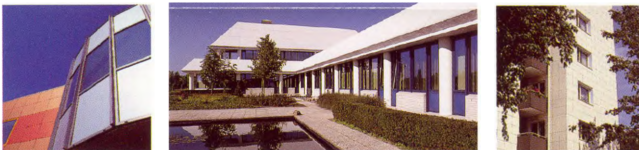
Gevelbekledingplaten met een uitstekende weerbestendigheid en kleurechtheid.