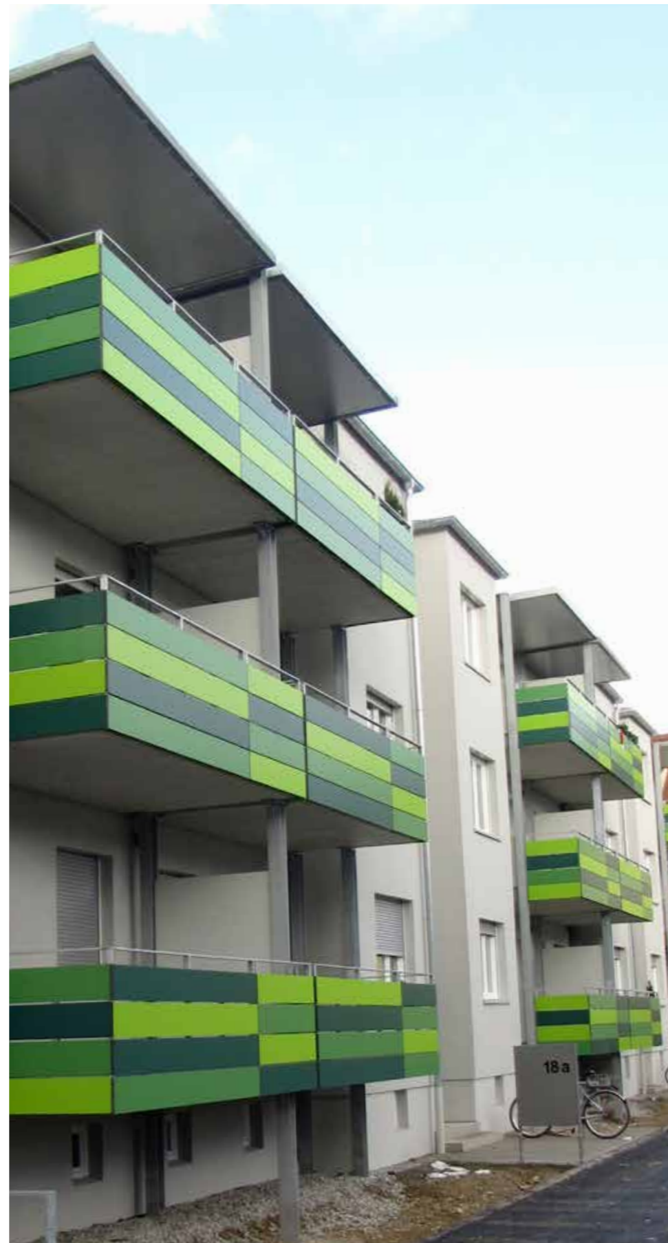
Angerhof | Augsburg | Duitsland

“In aanvulling op hun hoogwaardige esthetiek zijn Trespa® Meteon®-platen zeer duurzaam en presteren ze bijzonder goed in de buitenlucht. Trespa® Meteon® ziet er jarenlang mooi uit en draagt bij aan mooie, duurzame balkons.”