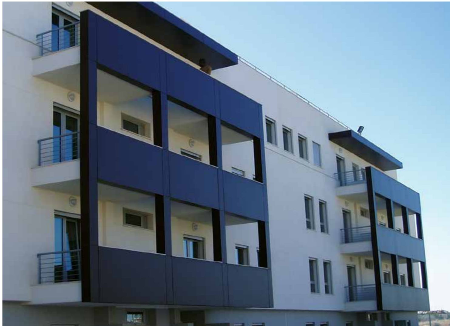
Wooncomplex | Lissabon | Portugal

Trespa® Meteon®-producten bevatten tot 70% natuurlijke vezels. Het volledige productassortiment van Trespa® Meteon® is nu op verzoek in beperkte hoeveelheden en binnen bepaalde rechtsgebieden met PEFC™ of FSC™ certificering leverbaar.