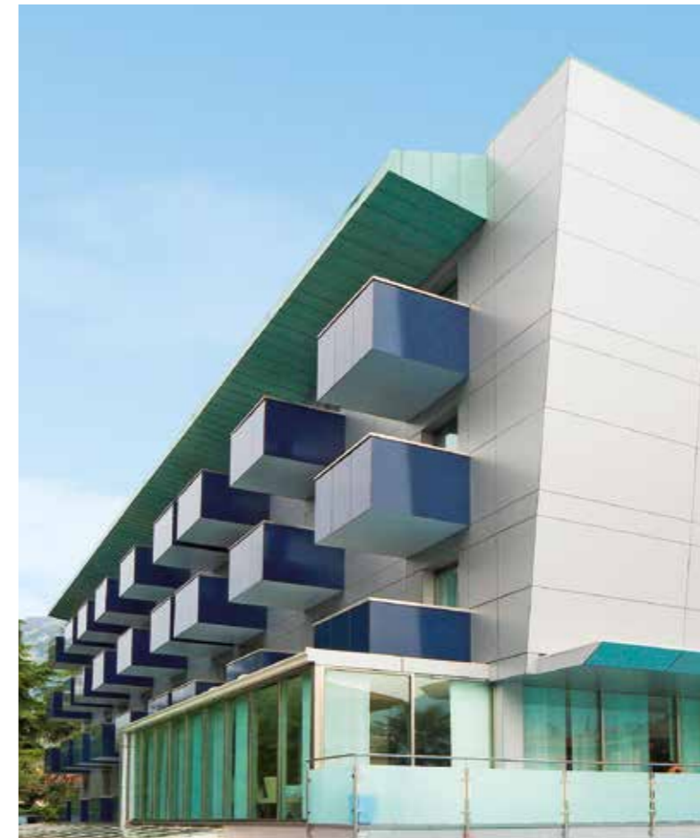
Hotel Caravel | Torbole | Italië