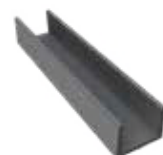
DF1U42 Groot U-profiel 4,2 x 3,5 x 182 cm (optioneel - om onder- aan met een betonnen onderplaat te starten)