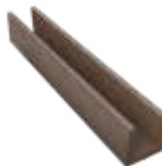
DF4U40 U-profiel voor lamellenafsluiting 4 x 5,5 x 202 cm (om de planken in te schuiven en als afwerkingsprofiel bovenaan laatste plank)