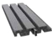
DF4B200 Plank 20 x 4 x 200 cm (verstevigd met gegalvaniseerd staal)