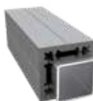
DF1PG2-90 Poortpaal 9 x 9 x 300 cm (optioneel - om Duofuse poort aan vast te maken, verstevigd met stalenkern)