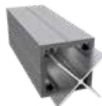
DF1P90 Paal 9 x 9 x 270/300 cm (verstevigd met aluminium kern)