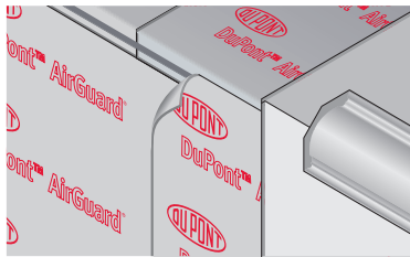
Fig. 2 - Vloerpenetraties