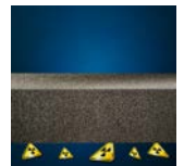
Bescherming tegen radon